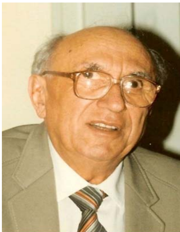
Борис Авраамович Трахтенброт